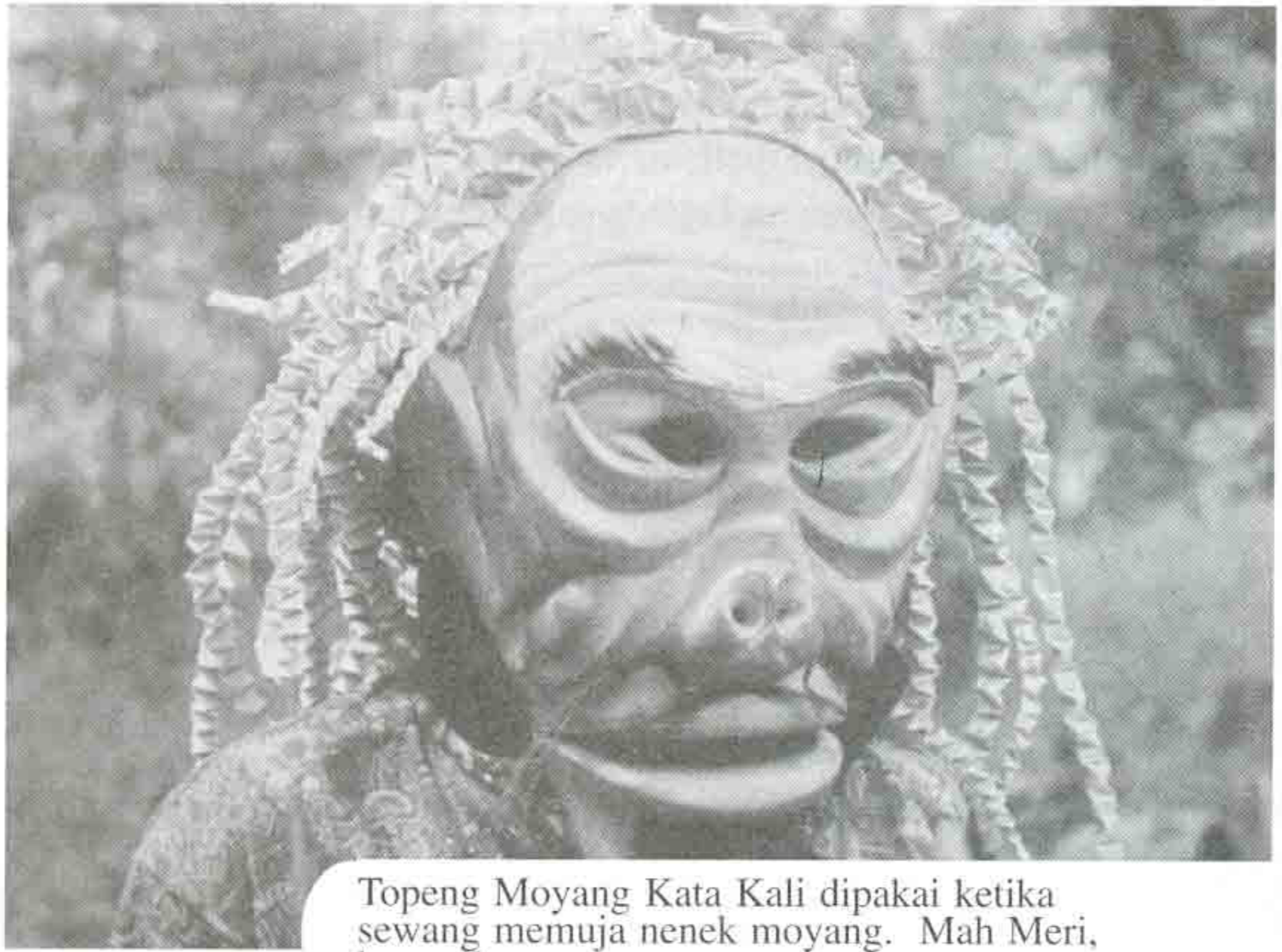
Topeng Moyang Kata Kali dipakai ketika sewang memuja nenek moyang. Mah Meri, kaum Carey.