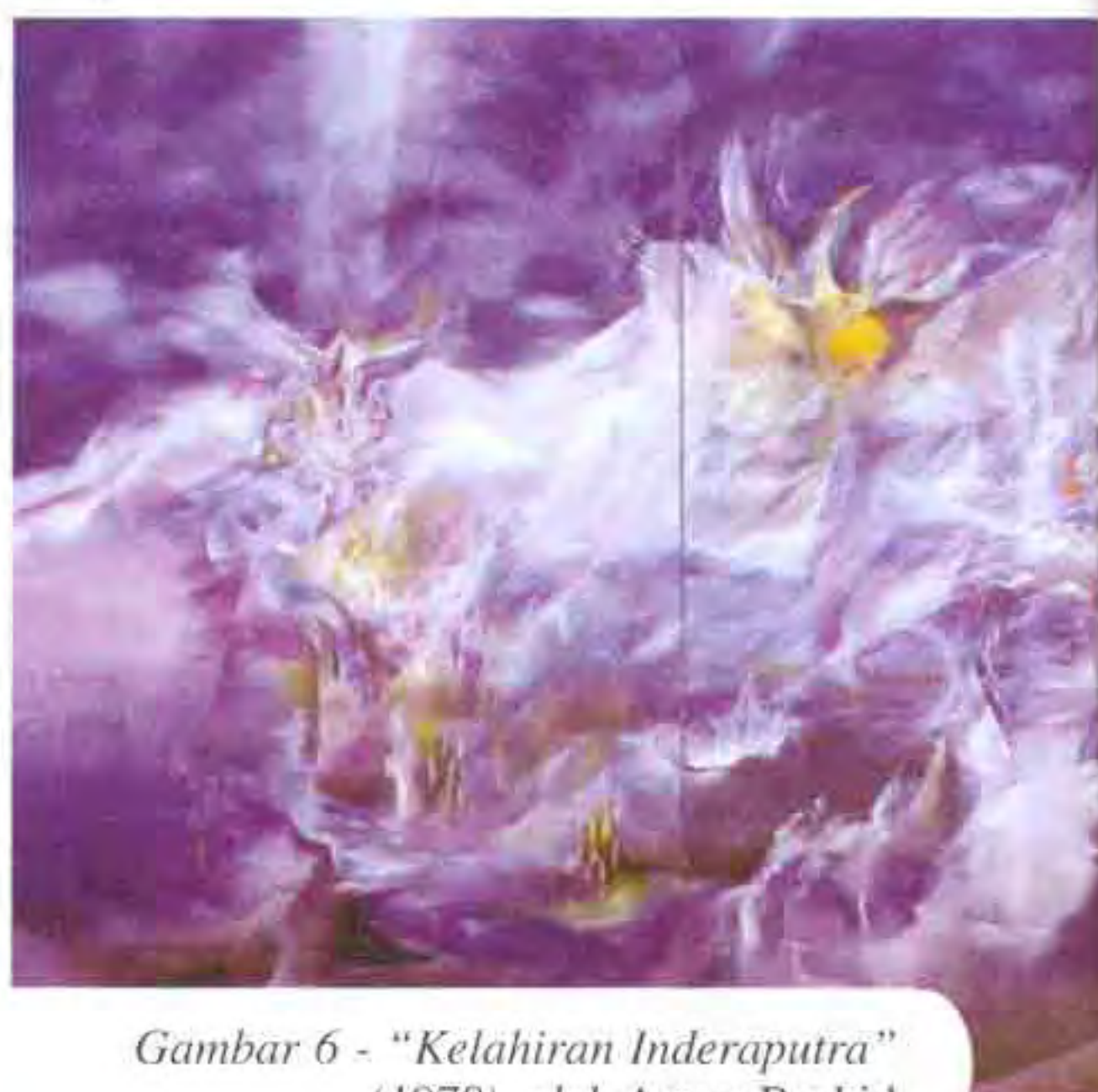
Gambar 6 - "Kelahiran Inderaputra" (1978) oleh Anuar Rashid