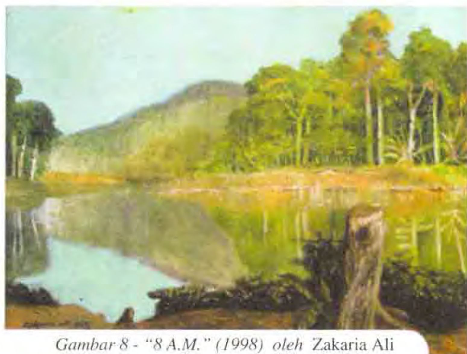
Gambar 8 - "8 A.M." (1998) oleh Zakaria Ali