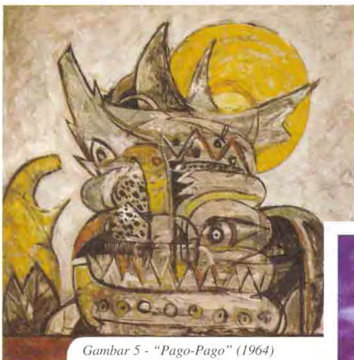
Gambar 5 - "Pago-Pago" (1964) oleh Abdul Latiff Mohidin