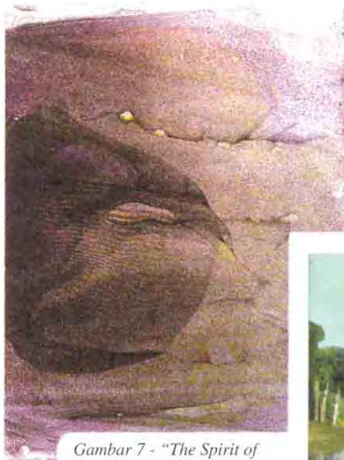
Gambar 7 - "The Spirit of Batu Ferringhi" (1987) oleh Chew Teng Beng