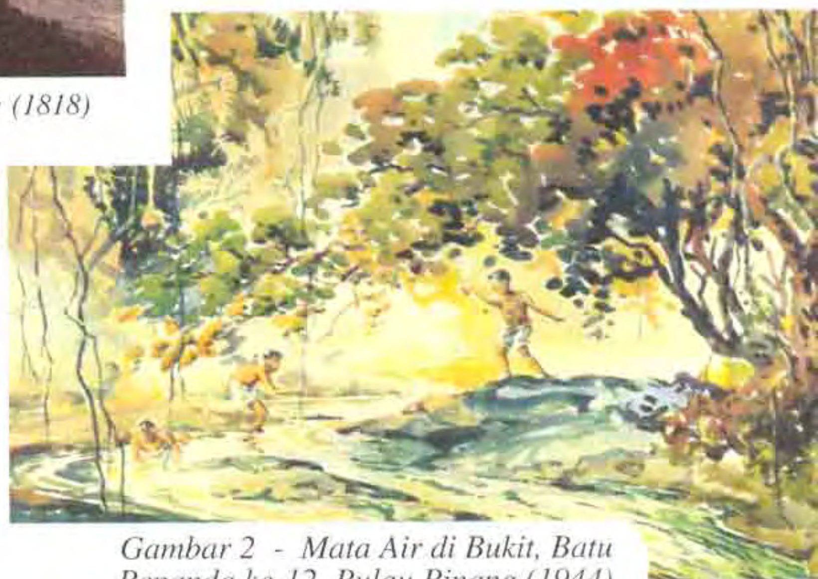
Gambar 2 - Mata Air di Bukit, Batu Penanda ke-12, Pulau Pinang (1944) oleh Abdullah Ariff