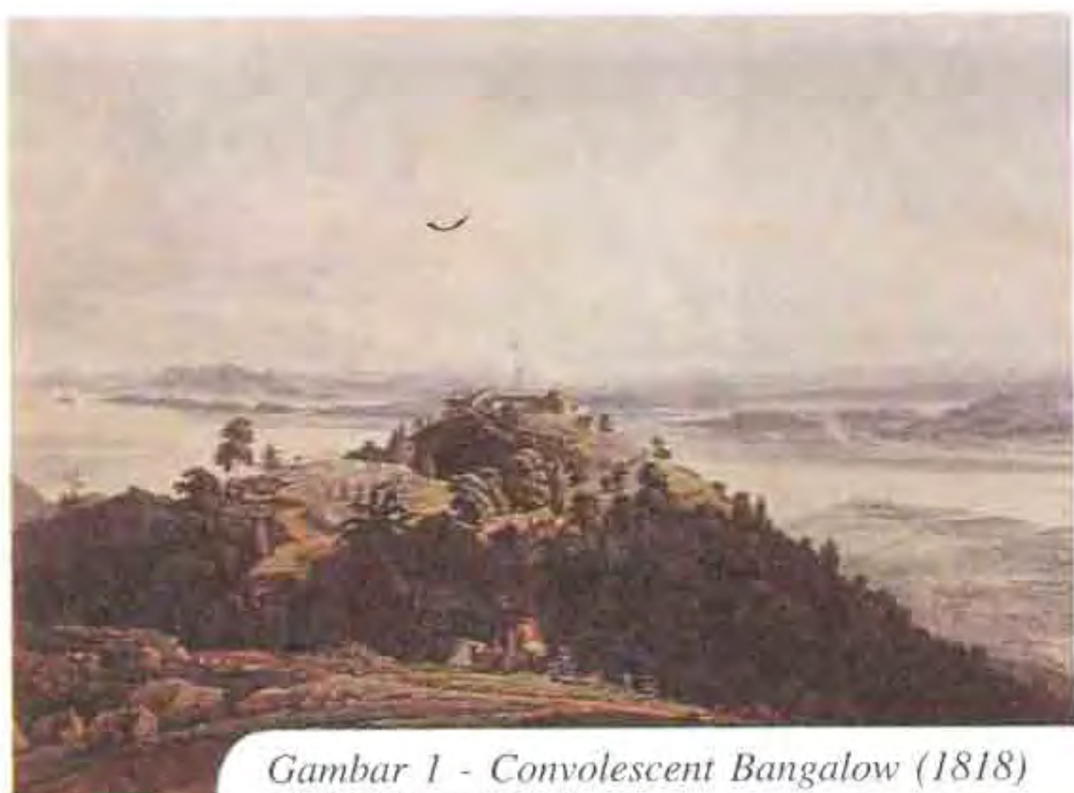
Gambar 1 - Convolescent Bangalow (1818) oleh Robert Smith