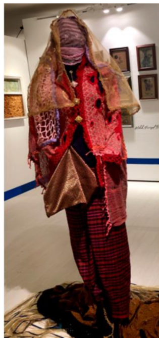
Foto 5 Siti Zainon Ismail, Kekasih - Uda dan Dara (2018). Benang bulu, tekstil tenunan, dan batik.

Sehingga kini, berbagai ragam gaya persembahan muncul oleh rindu kasih yang lebih menyayat seperti dalam “ Kekasih ” (1971). Tiga judul karya ini sudah sekian lama berkembang dalam proses kerja Siti Zainon. Malah beliau selaku pelukis membangunkan sikap berani berwatak lantang dan tidak sekalipun bersedih pilu. Beliau merasai peritanya kisah cinta Dara, hingga bangun dan bersuara seperti yang dihadapinya dalam kerja seni: percintaan bukan harus berduka, dan cinta Dara dalam karya ini dikait, dijahit baju silam robek, selendang yang tidak sempat dipakai di pelaminan terus terkibar melayang. Awan-gemawan bukan lagi biru tetapi hirisan darah berkilauan merah. Namun tiga kerongsang tetap bersinar cerah di dada. Begitulah puitisnya karya seni yang dihasilkan Siti Zainon, Sasterawan Negara yang menggabungkan bidang seni visual dan seni sastera.