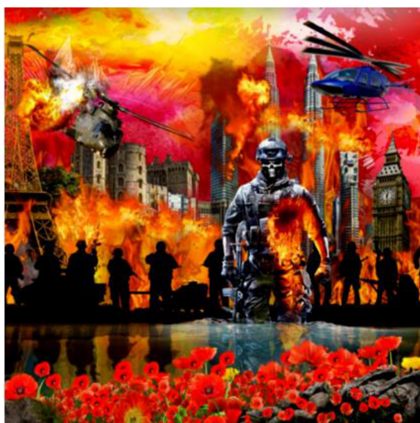
Foto 4 Md Nasir Ibrahim, Bunga Popi II (2020). Media digital, 120 cm × 120 cm.

Karya Bunga Popi II (Foto 4) oleh Md Nasir Ibrahim mengetengahkan isu-isu berkaitan peperangan. Bunga popi walaupun cantik tetapi merupakan simbol kepada peperangan. Usman Awang sangat membenci peperangan kerana kesannya kepada manusia, harta benda, alam, dan kesejahteraan hidup. Subjek yang diketengahkan melalui watak utama seorang perajurit yang luka meninggalkan kancah peperangan. Kesan daripada peperangan jika tidak dicegah, dipersembahkan melalui keruntuhan bangunan-bangunan ikonik yang mempunyai sejarah tersendiri seperti Menara Berkembar Petronas, Eiffel Tower, dan Big Ben.