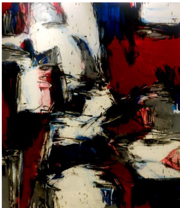
Foto 1 Suzlee Ibrahim, Pahlawan (2009). Akrilik dan cat minyak atas kanvas, 120 cm × 150 cm.

Gaya paling dominan ialah abstrak ekspresionisme yang bercirikan garisan-garisan bebas dan spontan diiringi dengan warna-warna cerah serta sapuan berus yang spontan. Misalnya karya Suzlee Ibrahim bertajuk Pahlawan (Foto 1).