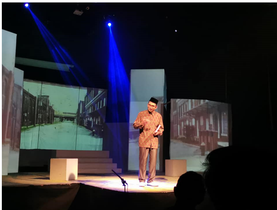
Foto 6 Watak Syed Ali yang sedang beraksi.

Watak sampingan telah membantu untuk menghidupkan mutu persembahan. Watak Syed Zabidi dan Silbi dilakonkan oleh orang yang sama dan kedua-dua watak ini adalah antagonis. Lakonan watak jahat telah berjaya memberikan kekusutan terhadap watak protagonis, termasuk watak Pak Ku yang juga bersubahat dalam propagandanya. Pujian harus diberikan kepada mereka yang menjayakan watak-watak sampingan kerana telah melengkapkan jalan cerita dengan baik serta berjaya mencuit hati para penonton dengan gerakan fizikal yang dilakukan bagi menambahkan lagi elemen dramatik dalam persembahan.