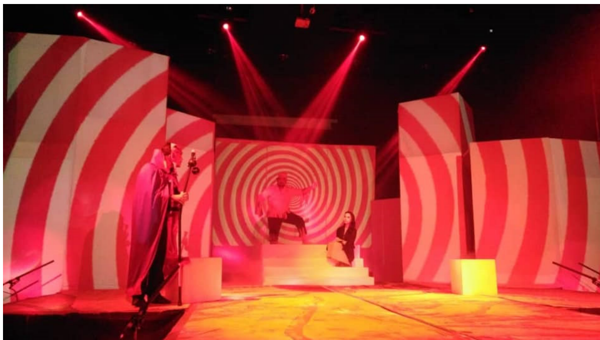
Foto 3 Set Pentas yang digunakan dalam pementasan Sarah .