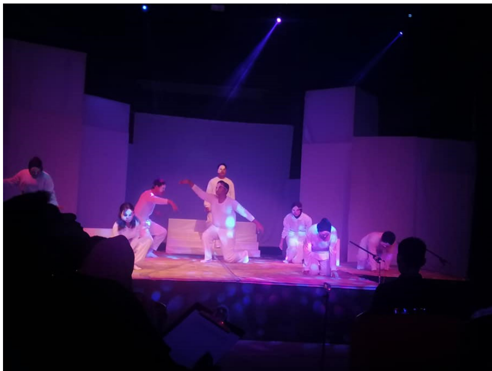
Foto 5 Persembahan assemble dalam teater Sarah.