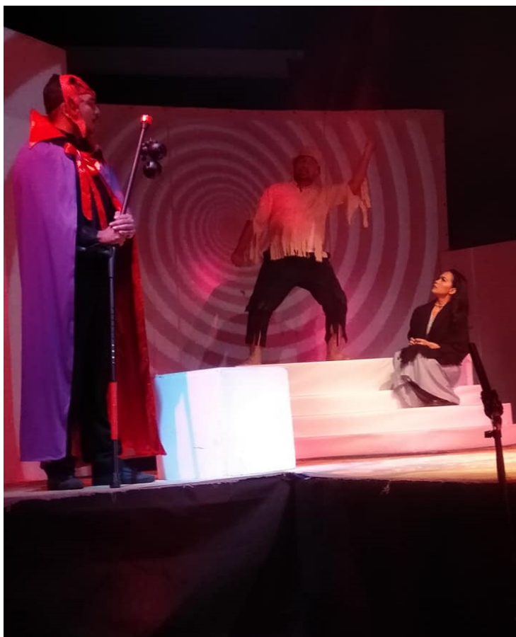
Foto 7 Watak sampingan yang sedang beraksi.