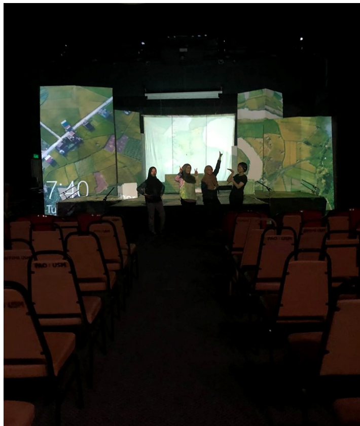
Foto 4 Keadaan set yang dipancarkan menggunakan LCD.