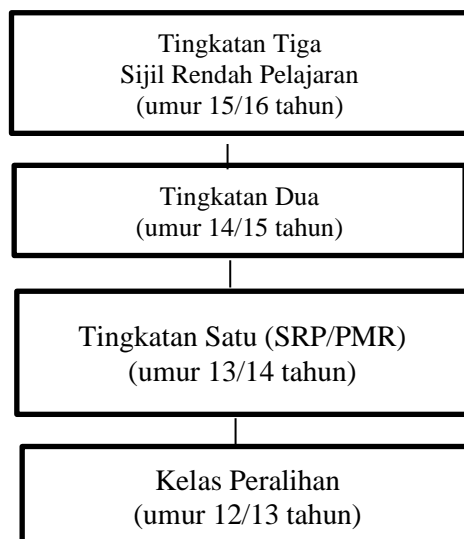
Carta 1: Aliran Sistem Baharu Persekolahan Agama Negeri Kelantan Tahun 1971

Rujukan: Diubahsuai daripada Abdul Razak, MAIK: Peranan dalam Bidang Keagamaan, Persekolahan dan Penerbitan di Kelantan sehingga 1990 , hlm.134