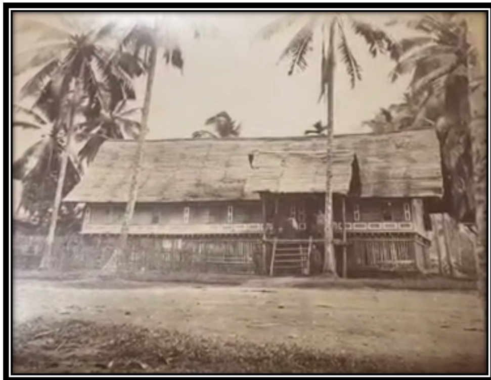
Rajah 4: Rumah kediaman Ngah Ibrahim di Bukit Gantang.