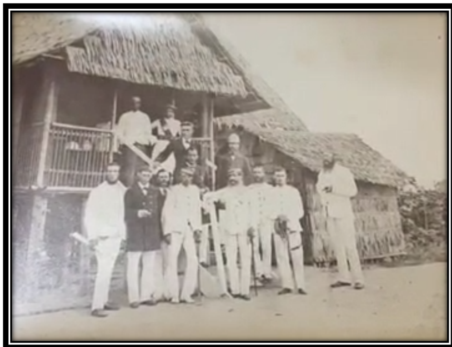
Rajah 6: Pegawai-pegawai British di Bandar Baru. Kelihatan dalam gambar ini ialah Frank Swettenham (dua dari kiri), J.W.W. Birch (empat dari kiri berbaju putih bersandar tepi tangga), Gabenor Sir William Jervis (lima dari kiri) dan Kapten Speedy (kanan sekali).