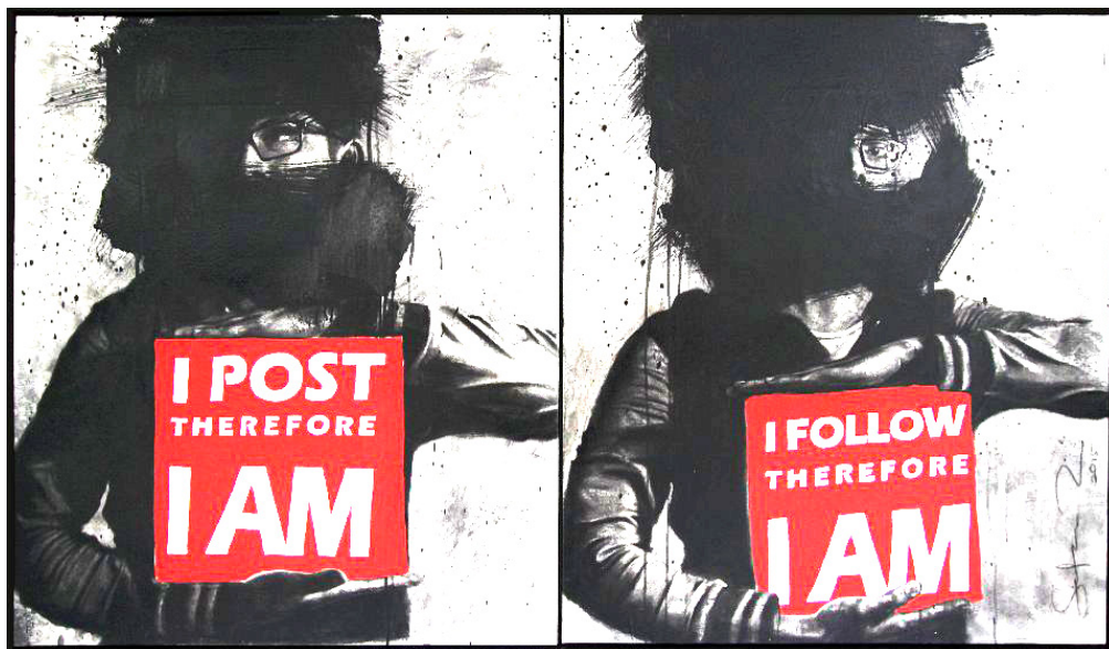
Gambar 1 Safar Zain, Mainstream (diptych), 2015. Akrilik dan arang pada kanvas. 106 × 91.5 cm. Imej: G13 Gallery.

Maka karya Safar saya fikir bergerak dalam konteks idea yang kuat serta relevan dalam memberi konotasi dan refleksi kehidupan semasa. Dari sudut pengayaan, ciri teks yang disertakan dalam karya Safar Zain ini mengingatkan kita kepada karya seniman sezaman Amerika pada tahun 1980-an iaitu Barbara Kruger yang menekankan aspek skala, ciri dan kesan grafik dalam menyampaikan pesan (mesej). Ciri teks putih berlatarbelakangkan warna merah telah menjadi trademark unggul kepada karya Barbara Kruger dan sifat ini secara kebiasaannya wujud pada karya Safar Zain.