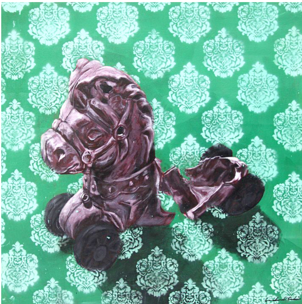
Gambar 2 Heikal Taki, Sheltered Dreams, 2015. Akrilik pada kanvas. 92 × 92 cm.