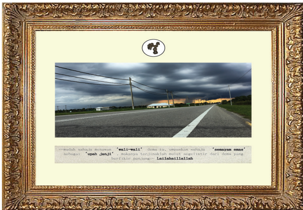
Foto 4 Imej fotografi digital dalam karya Suasana Mendung di Cempaka Sari (2018).