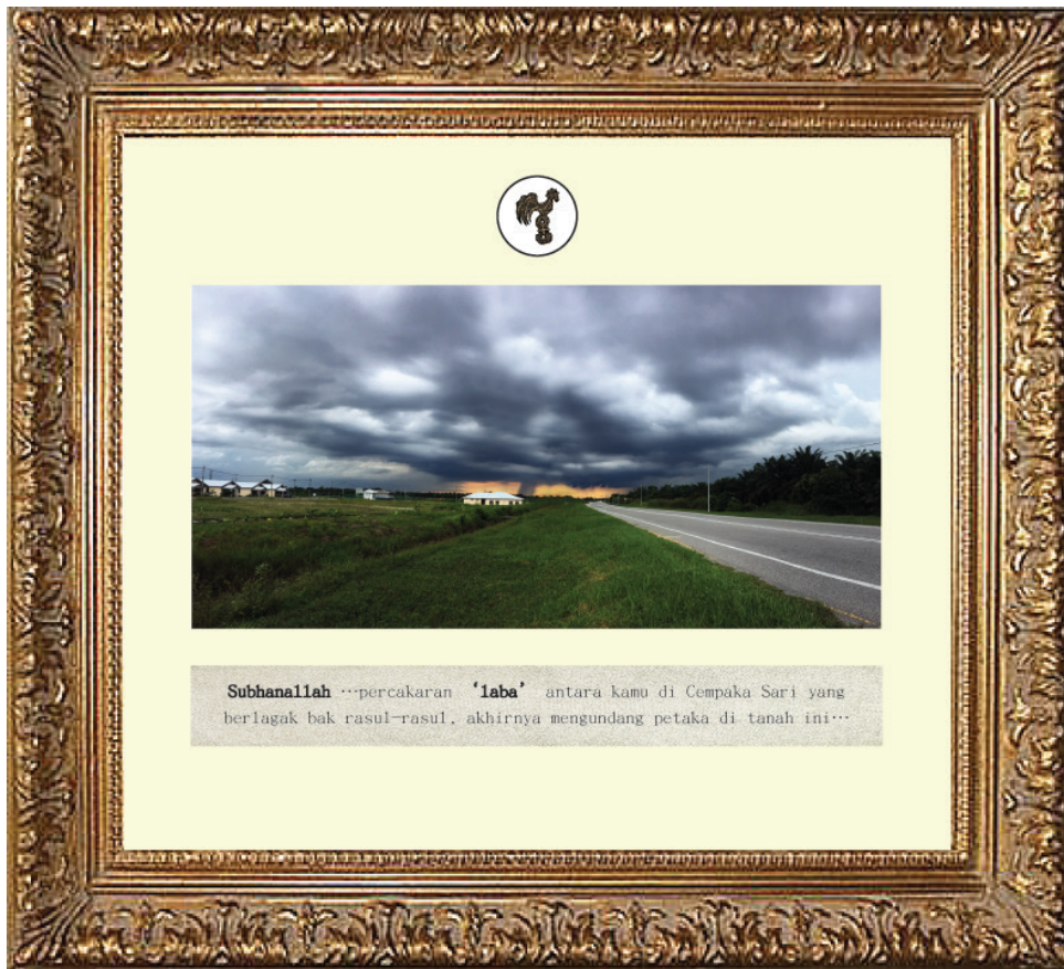
Foto 3 Imej fotografi digital dalam karya Suasana Mendung di Cempaka Sari (2018).