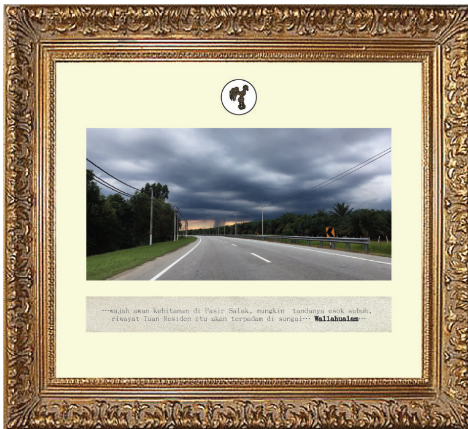
Foto 2 Imej fotografi digital dalam karya Suasana Mendung di Cempaka Sari (2018).