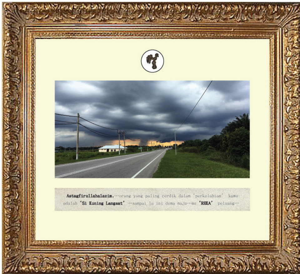
Foto 5 Imej fotografi digital dalam karya Suasana Mendung di Cempaka Sari (2018).