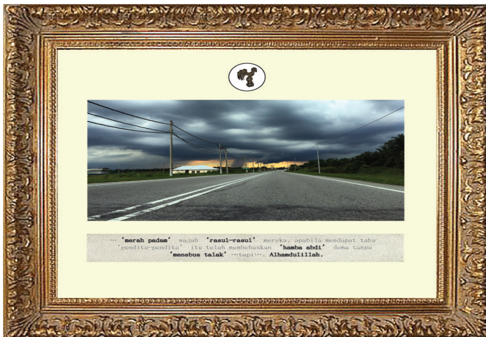
Foto 6 Imej fotografi digital dalam karya Suasana Mendung di Cempaka Sari (2018).