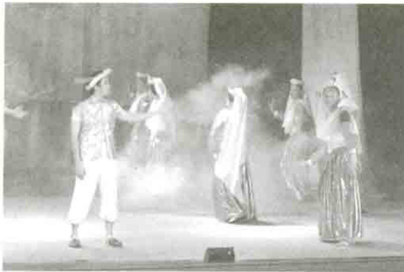
Anak mambang memikat puteri Jula Juli.