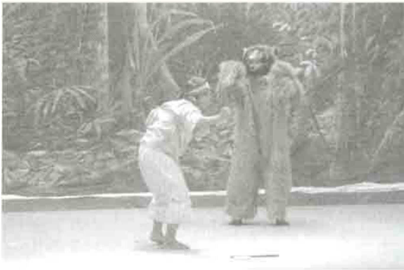
Meletup didatangi oleh beruang.

Kumpulan bangsawan Sri USM mengekalkan tradisi bangsawan di dalam Jula Juli Bintang Tujuh