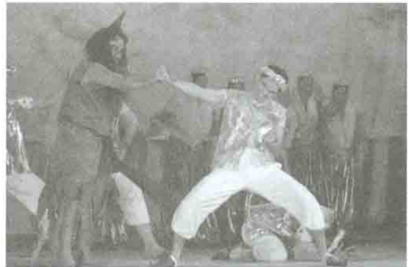
Pertarungan Jin Afrit dan anak mambang.

seorang wanita yang mandul dan kemudiannya wanita tersebut mengandung lalu dikurniakan dengan tujuh orang bayi perempuan. Suami wanita tersebut terasa amat terharu dan bersyukur kerana sebelum ini telah lama mereka berkahwin tetapi tidak dikurniakan zuriat.