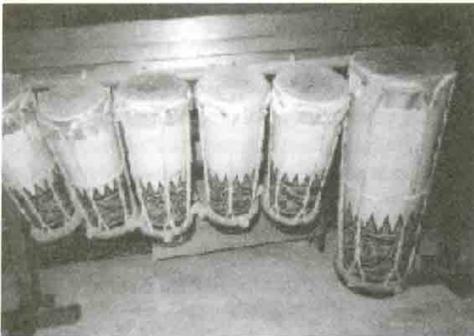
Gambar 2: Taganing dan Gordang

menari dengan gembira dan khusyuk, saling menunjukkan rasa persaudaraan, sehingga terjadilah suatu integrasi yang erat di antara mereka yang menyatu dalam irama dan melodi musik gondang sabangunan .