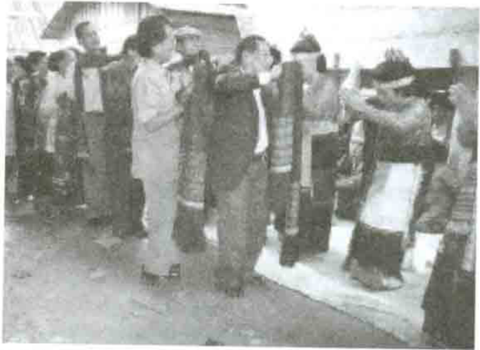
Gambar 3: Boru dengan khusuk menari menyembah memohon berkat dari hula-hulanya