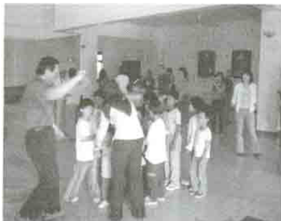
Foto 3 Modul dicuba ke atas kanak-kanak