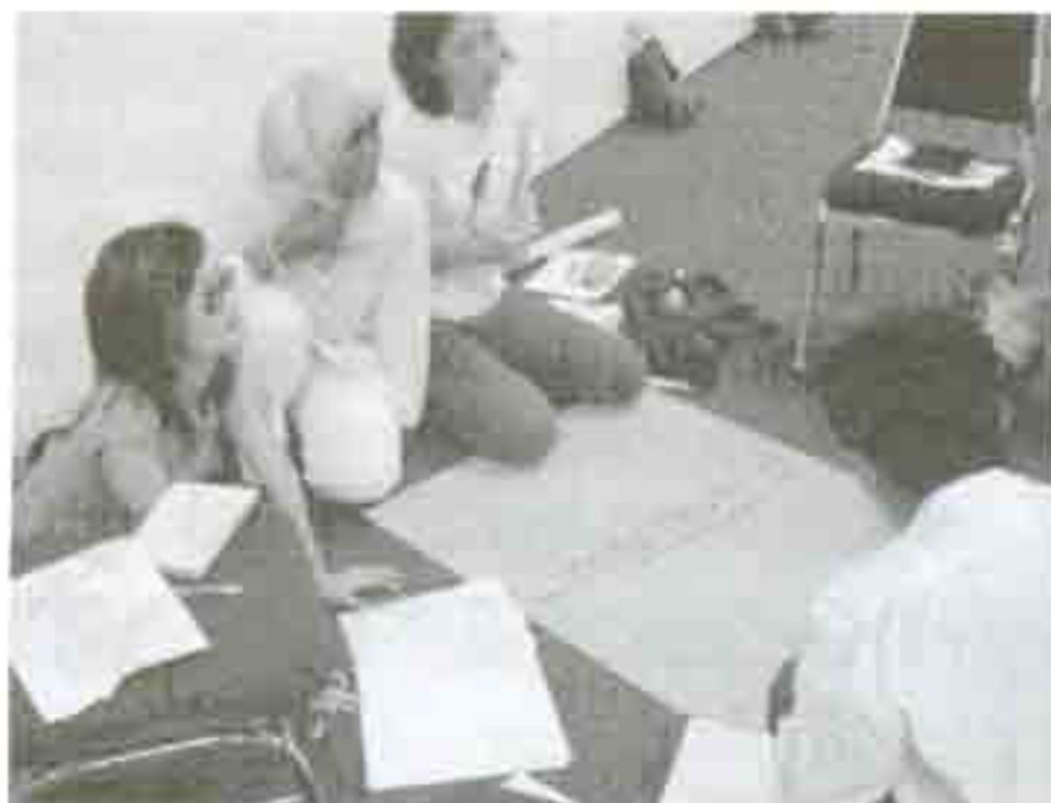
Foto 2 Berbincang dalam menghasilkan modul pengajaran