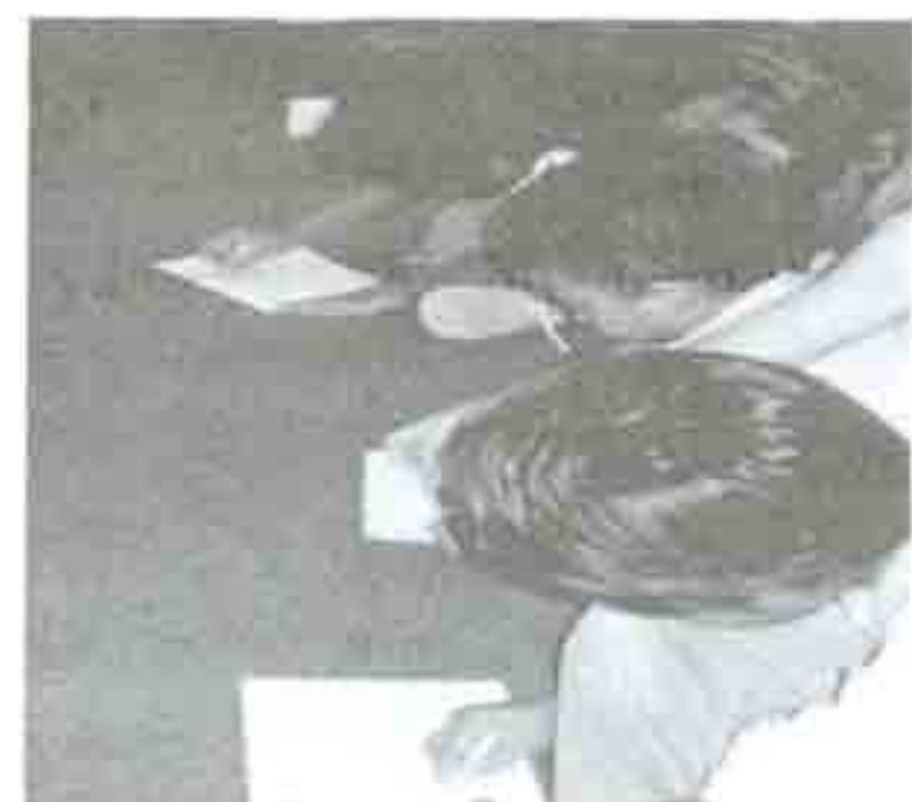
Foto 4 Modul dicuba ke atas kanak-kanak