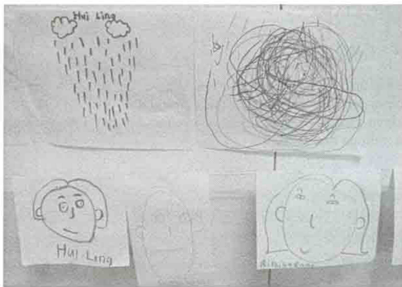
Foto 5 Hasil lakaran kanak-kanak