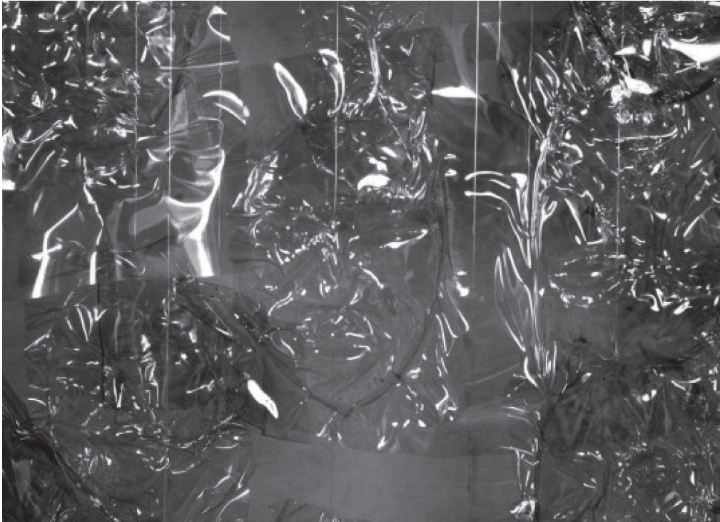
Gambar 1 Izan Tahir, WHEN YOU ARE AWAY , 2009, Akrilik dan perspek, pelbagai saiz, koleksi seniman.